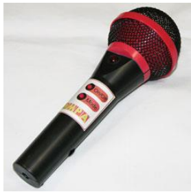
21917 ROMPA® Wi-Fi Microphone