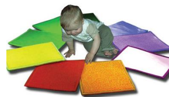
19939 Wireless Interactive Mat Switch Set