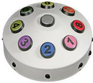
19847 ROMPA® 8 Colour Wire free Controller

ROMPA® also offers a wide range of Wi Fi controllers, including: