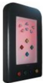
19214 – Colour Changing Panel