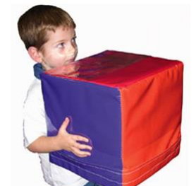
18870, 20402 Talking Cubes by ROMPA®